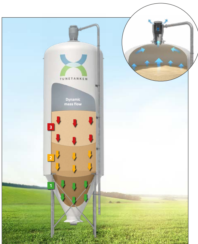
Un sistem eficient de alimentare cu ciclon și ventilație distribuie materialele, asigurând o stocare optimă a materialelor și astfel, minimizează riscul de condensare.