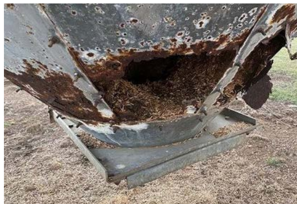
Silozurile din fibră de sticlă nu se corodează! Sarea și amoniul din furaje, combinate cu condensul de apă, duc la coroziune, la care materialele compozite sunt rezistente.

Silozurile de exterior Tunetanken sunt de cea mai înaltă calitate. Sunt fabricate din material compozit armat cu fibre. Un material unic care este, de asemenea, folosit pentru fabricarea